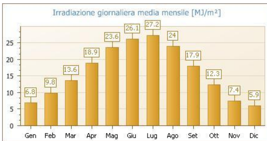
Irradiazione giornaliera media mensile sul piano orizzontale [MJ/m 2 ] - Fonte dei dati: UNI 10349

Quindi, i valori della irradiazione solare annua sul piano orizzontale sono pari a: